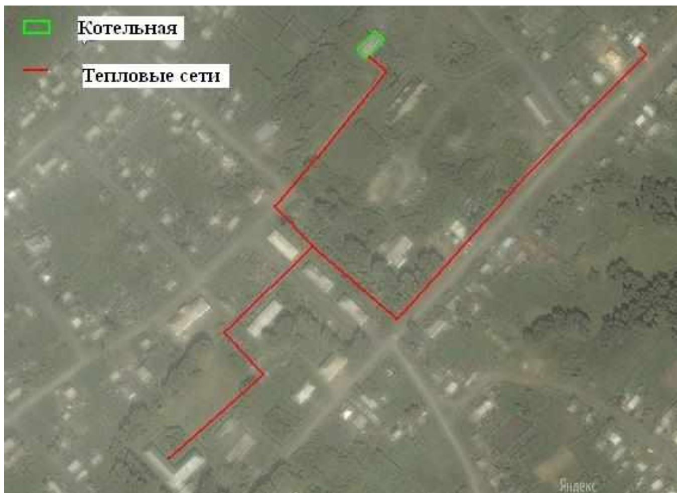
Рис. 2 Существующая зона действия котельной п. Шишино