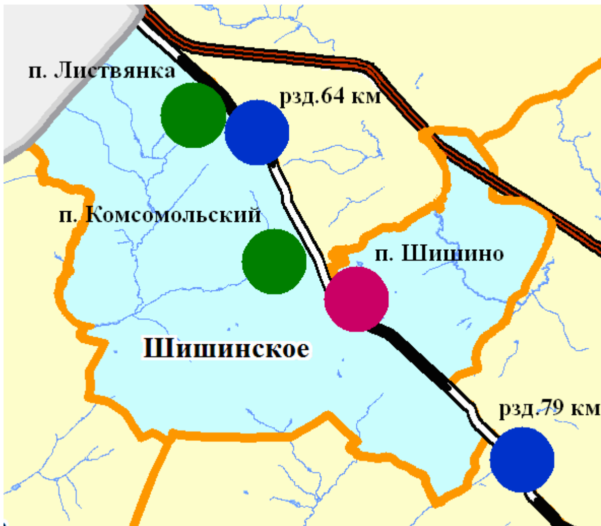
Рис.1. Расположение населенных пунктов

На территории указанных сельских населенных пунктов находится один централизованный источник тепловой энергии – коммунальная котельная п. Шишино МКП «ТЕПЛО». Состав и техническая характеристика котельной приведена в таблице 1.